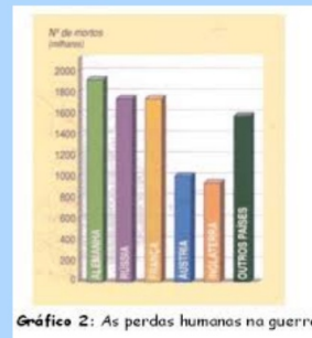
Gráfico 2: As perdas humanas na guerra